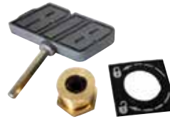
ACG8672 SCHLOSS MIT SECHSKANTSCHLÜSSEL