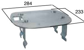
ACG8108 GRUNDPLATTE für K500