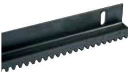
ACS9050 ZAHNBÄUM M4 aus Metall (Fläche 22x22mm) mit KATAPHORESER Behandlung, Winkelprofil (bis 2200 kg) für K500 FAST empfohlen In Barren von 2 m pro m 45 €