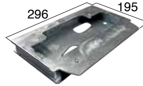
ACG8117 GRUNDPLATTE Adapter C-BX für K500