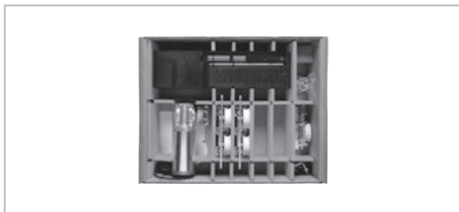
KIT SLIDER 160 1 ANTA / 1 DOOR code AD90012