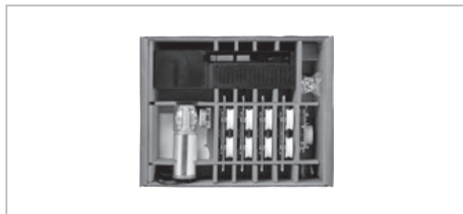
KIT SLIDER 160 2 ANTE / 2 DOORS code AD90013